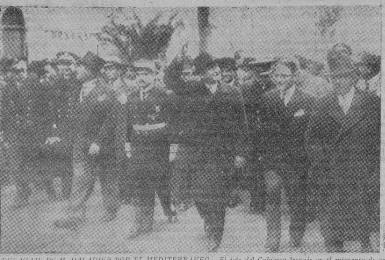
DEL VIAJE DE M. DALADIER POR EL MEDITERRANEO.—El jefe del Gobierno francés en el momento de su llegada a Ajaccio

Londres, 9.—Los diarios y los círculos oficiales militares anuncian que tras el fulminante avance nacional en el frente de Cataluña en los sectores del Norte—Artesa—y Sur—Borjas Blancas—todo el frente marxista del Centro se halla gravemente amenazado y en inminente peligro de rodeo total. Añaden que en el día de ayer, fuertemente batidas por los soldados nacionales, las tropas marxistas abandonaron todas sus posiciones del Segre. LLEGAN A GENOVA NUMEROSOS INGLESES PARA RECIBIR A MR. CHAMBERLAIN Genova, 10.—Desde esta mañana están llegando turistas británicos procedentes de toda Italia y de las estaciones invernales de Suiza para saludar