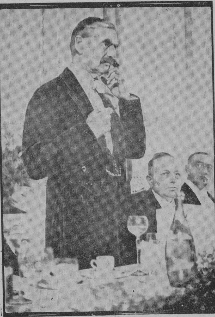
Mr. Chamberlain que, en compañía de lord Halifax, llegará hoy a París, de paso para Roma. En la Ciudad Eterna tendrá lugar mañana una de las conferencias políticas internacionales de mayor trascendencia de la presente época

Nueva York, 9.—Hoy se detendrán en París Mr. Chamberlain y lord Halifax para conferenciar con M. Daladier durante el viaje de aquéllos a Roma. Se informa que el jefe del Gobierno francés no permitirá que se sacrifique territorio alguno del Imperio francés en nombre del apaciguamiento europeo. Después de su viaje a Túnez, Daladier ha reforzado su convicción de que Francia puede defenderse y no se muestra conciliador con el Duce en la cuestión del Mediterráneo, por lo que hará entrega de un mensaje a Mr. Chamberlain para que éste le haga llegar al jefe del Gobierno italiano, relativo a la situación. Parece que un «no» rotundo se establece en dicho mensaje a las demandas italianas y en relación con el problema español, rechazando cualquier ofrecimiento de mediación británica en la cuestión franco-italiana. Se sabe que Daladier no está dispuesto a hacer concesiones al Generalísimo, por entender que la cuestión del reconocimiento de los derechos de beligerancia a Franco no debe ser abordada hasta que Burgos retire todas las fuerzas extranjeras.