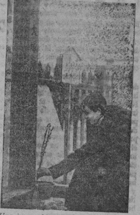
Una joven china deposita flores al pie de un monumento erigido en honor de los soldados caídos en el frente de Lang-jang, del Norte de China

Ha ocurrido un accidente sensible, aunque no grave por fortuna. A causa de la aglomeración de público ante el grupo escolar de la calle Real de Burgos, una verja del mismo, a la cual se habían encaramado muchas personas, se derrumbó. Hay que lamentar un herido y varios contusos.