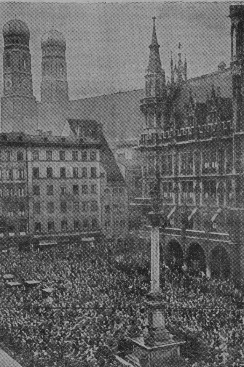
En primer plano, a la derecha, la residencia del Canciller alemán, en la que tendrá lugar la histórica conferencia.

Hoy es día de fiesta en el mundo de las gentes civilizadas. Que Dios no ponga de la mano a los hombres de buena voluntad que van a discutir sobre los destinos mundiales en una ciudad de la Gran Alemania.