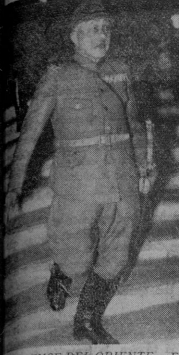
LAWRENCE DEL ORIENTE.—El japonés Dohihara, conocido con el nombre de "El Lawrence de Oriente", aparece de nuevo después de un misterioso viaje por el Norte China. En la fotografía aparece saliendo del ministerio de la Guerra en Tokio