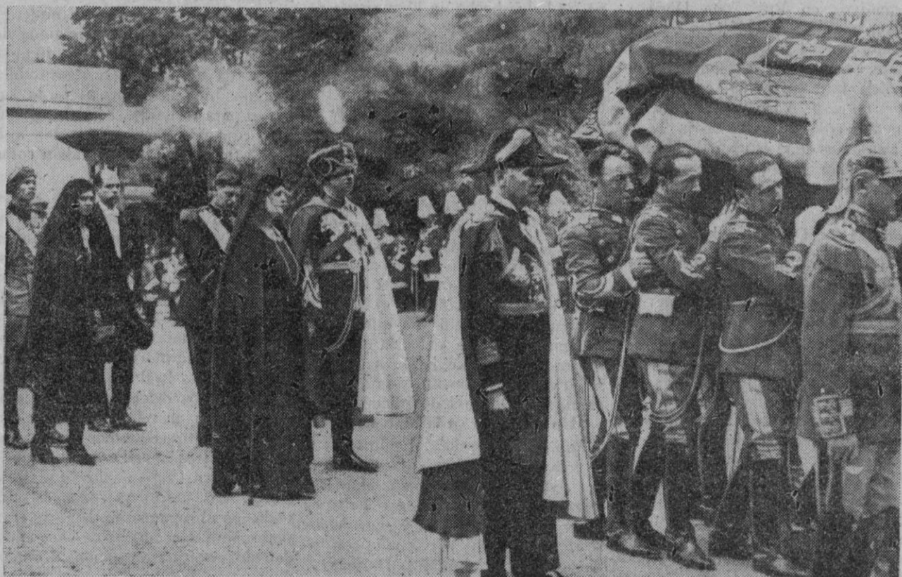
LA MUERTE DE LA REINA MADRE DE RUMANIA.—Acto del sepelio de la Reina María. El féretro es conducido por oficiales del Ejército. Inmediatamente detrás, el Rey Carol y la princesa Isabel, el príncipe heredero Miguel, la archiduquesa Ilana de Habsburgo y el príncipe Nicolás

Budapest, 1.—En los círculos políticos húngaros ha causado sensación