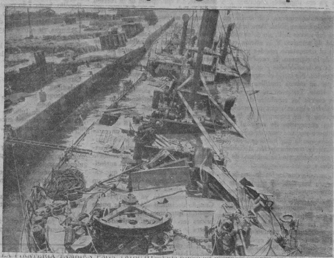
LA ARTILLERIA TAMBIEN PAGA TRIBUTO.—Vista parcial del puerto de Valencia, en el que naufragó hundidos por los aviones nacionales varios buques piratas dedicados al contrabando de armas. Los extranjeros, mercaderes de sangre española, también suelen pagar fuerte tributo a la «vigilancia alada» de la España Nacional

Zaragoza, 27 (3 t).—Durante toda la mañana ha continuado la operación de limpieza en el sector del valle inferior del Ebro, siendo capturados