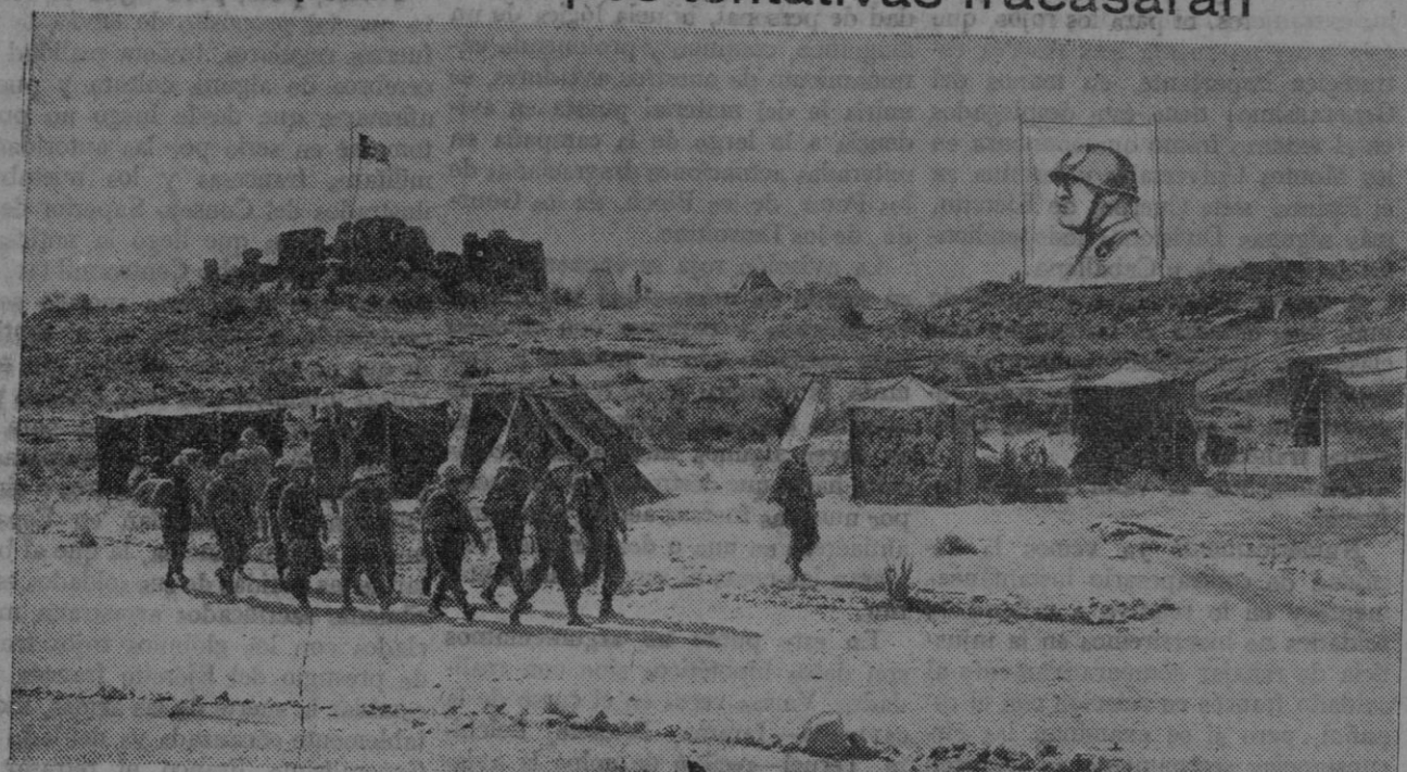
Documento gráfico del período de conquista del territorio de Abisinia por las tropas italianas

¿Qué se pretende? Sencillamente dar tiempo a que el ex Negus llegue a Ginebra y haga su entrada en el sa- lón de sesiones de la Liga, siquiera sea solamente para regocijar a los se- ñores delegados. Pero existe una en- cubierta intención: la de provocar, mediante la presencia del ex Negus, una situación que pueda influir en las relaciones italoinglesas y en la marcha de las negociaciones franco- italianas. ¿Qué otra justificación pod- ría darse a esa teatral aparición del ex Negus en el Palacio de las Naciones? Evidentemente la Liga va de tumbo en tumbó, y o mucho nos equi- vocamos, o esa infame maniobra con- tribuirá a aumentar el movimiento de repulsa que se manifiesta contra el organismo ginebrino y contra la «se-