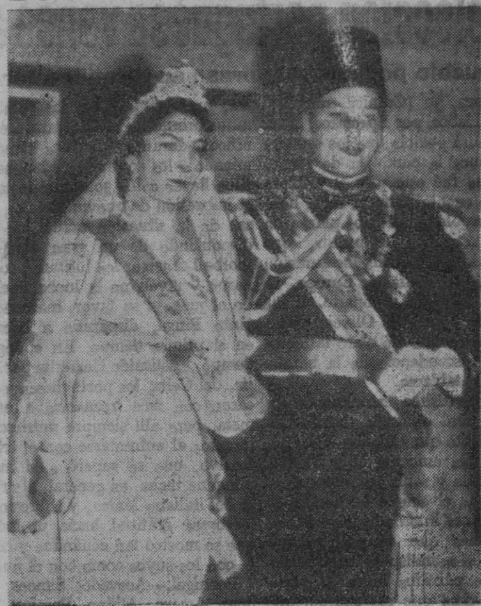
El Rey Faruk y la Reina Farida, fotografiados después de la ceremonia de su casamiento