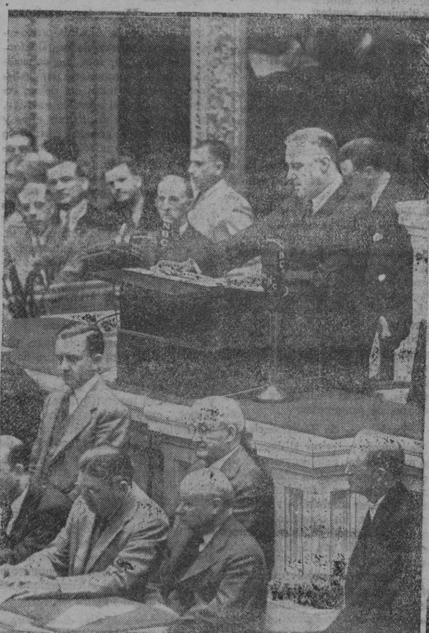
ROOSEVELT Y LA ECONOMIA DE LOS ESTADOS UNIDOS.—El Presidente de los Estados Unidos, dando lectura a uno de sus proyectos sobre reforma de la economía norteamericana. O no se entiende, o no le entienden, porque tan pronto se ve atacado por la plutocracia como por la "democracia" (entiéndase sindicales). Roosevelt atacó duramente, hace unas semanas, a los grandes industriales. Y ahora desencadenan contra el Presidente y contra el Gobierno yanqui una tremenda campaña los Sindicatos, los cuales acusan a aquellas jerarquías de haber llevado a la economía norteamericana al borde de la ruina. ¿No es un verdadero lío? A nosotros, por lo menos, nos lo parece. Quidás sea por la distancia.

¿Aconseja Washington a Londres que reconozca el Imperio italiano? La Sociedad de Naciones deriva hacia una Asamblea consultiva de tipo económico