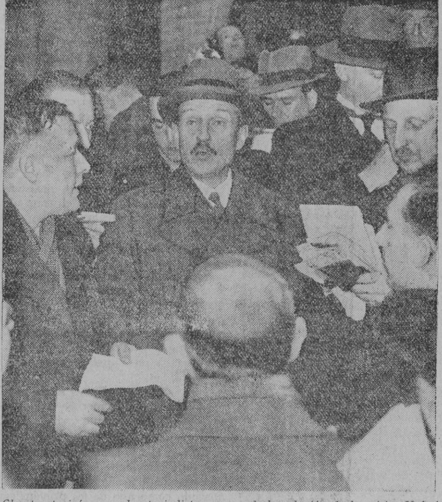
Chautemps informa a los periodistas acerca de la solución de la crisis. ¿Habrá explicado "todo"? Según Maurras, no.

complot de que se hacía víctima a Francia se han dado por vencidos socialistas y comunistas, sería candoroso. Recibieron la formación del Gabinete Chautemps como un mazazo en la cerviz, pero ya han empezado a reaccionar. Mañana llegarán representantes socialistas españoles. Los comunistas obran por su cuenta aparentemente, pero en contacto con aquéllos. Se entrevistarán los bolcheviques españoles con Thorez, con Jijunot y con el secretario de los Sindicatos de la C. G. T. Vienen a exi-