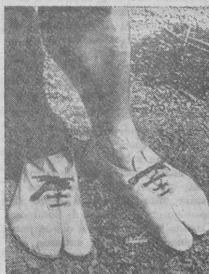
Los deportistas pedestres del Japón, que están entrenándose para la Olimpiada 1940, emplean zapatos con lugar especial para el dedo pulgar, lo que permite aprovechar mejor la fuerza del pie