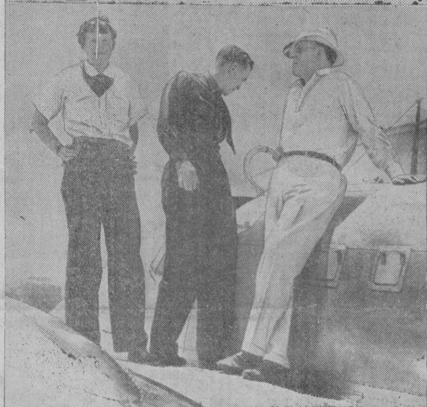
La famosa aviadora que en su vuelo alrededor del mundo ha caído en el Océano Pacífico, estando actualmente dedicados numerosos buques y aviones a su busca. Amelia aparece en la foto al lado del avión con su esposo George Palmer Putnam y su compañero de vuelo capitán Fred Noonan (en el centro). En el gráfico se ve la ruta seguida en su vuelo. Mrs. Earhart, salió de Miami (América) el día 1.º de Junio. El día 30 ocurrió el accidente