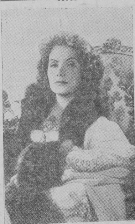
Greta Garbo en su último papel de "La Dama de las Camelias", en la película según la famosa novela de Alejandro Dumas

El próximo martes, para cuya fecha se cree que habrá contestado el Jefe nacionalista español, volverá a reunirse el Subcomité.