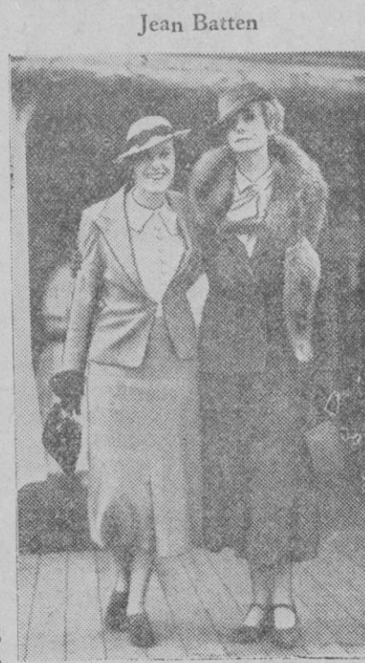
La célebre aviadora, retratada en Sidney junto a su madre, que llegó para felicitar a su hija en ocasión de su vuelo, felizmente terminado, Inglaterra-Nueva Zelanda

El peligro para Francia nunca puede venir de España, sino de Rusia, cuyas avanzadas formadas por los comunistas servidores de Moscú, han pasado ya, no sólo los Pirineos, sino todas las fronteras nacionales en Francia. ¡Rusia! He ahí el enemigo. Los comunistas franceses y escritores reclutados por el oro robado por Ros-