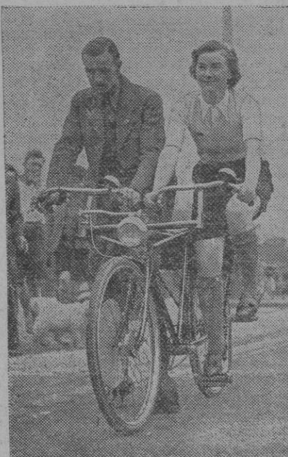
Un constructor inglés, considerando poco prácticas las actuales bicicletas, ha construido este modelo

Este número ha sido visado por la censura