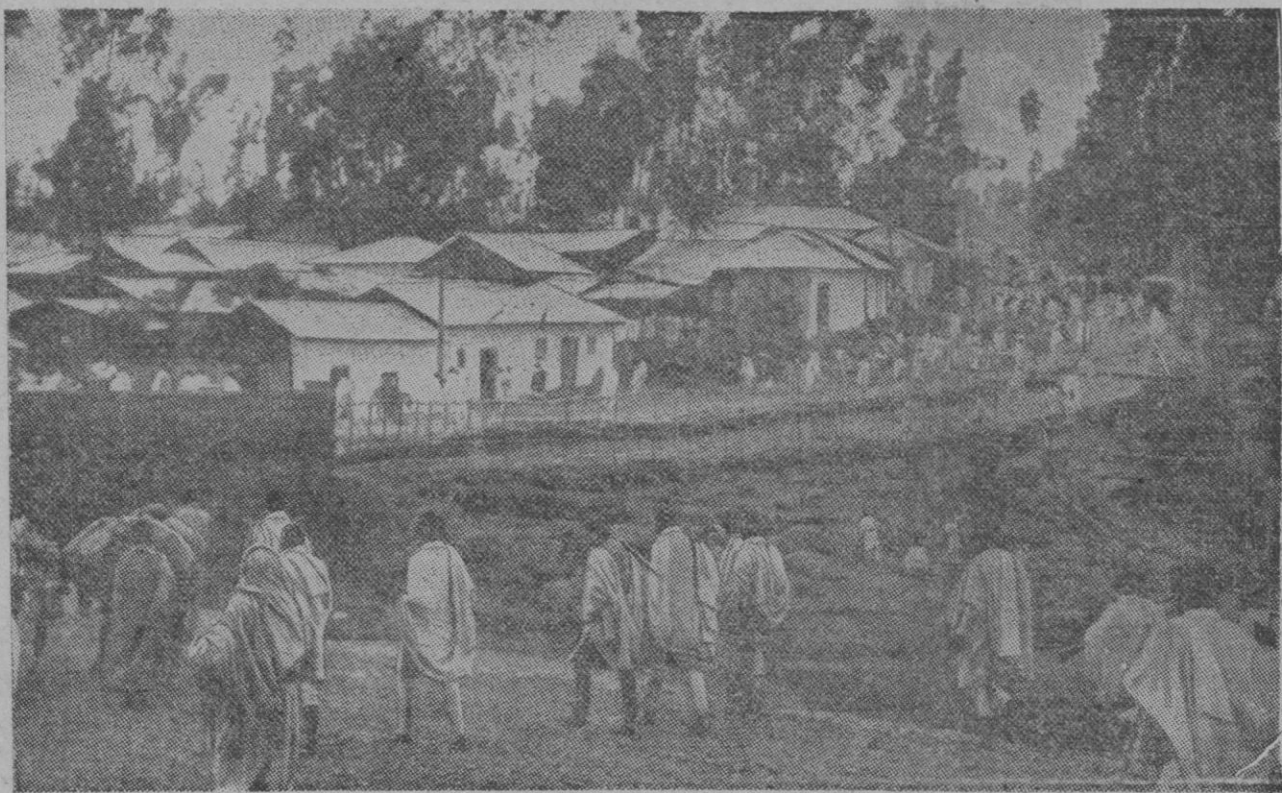
Una de las calles principales de acceso a la capital de Abisinia