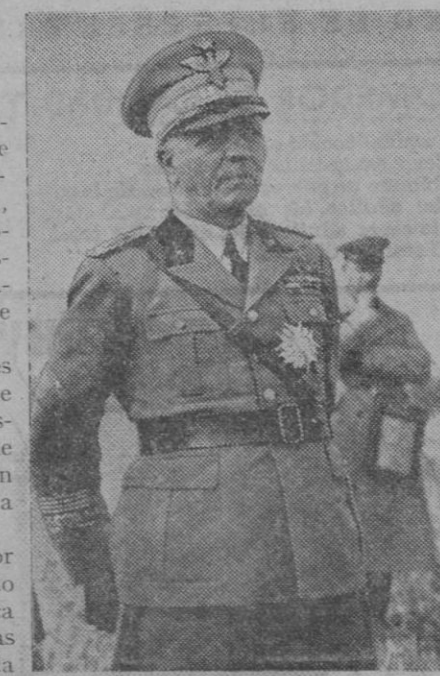
El general Badoglio, que será nombrado virrey de Etiopía

El jefe del Gobierno fascista, señor Mussolini, ha anunciado que el precio de la vuelta de Italia a la política europea es el levantamiento de las sanciones y el reconocimiento de la conquista de Etiopía. Francia y Gran Bretaña han anunciado que segui-