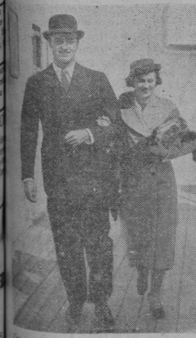
Juanes Roosevelt, uno de los hijos del presidente Roosevelt, se encuentra actualmente, en compañía de su esposa, en Inglaterra. La ilustración presenta a la pareja, retratada en Plymouth

Se representará, por los alumnos de la Escuela Normal de Maestros, la obra de Arniches «Para tí es el mundo».