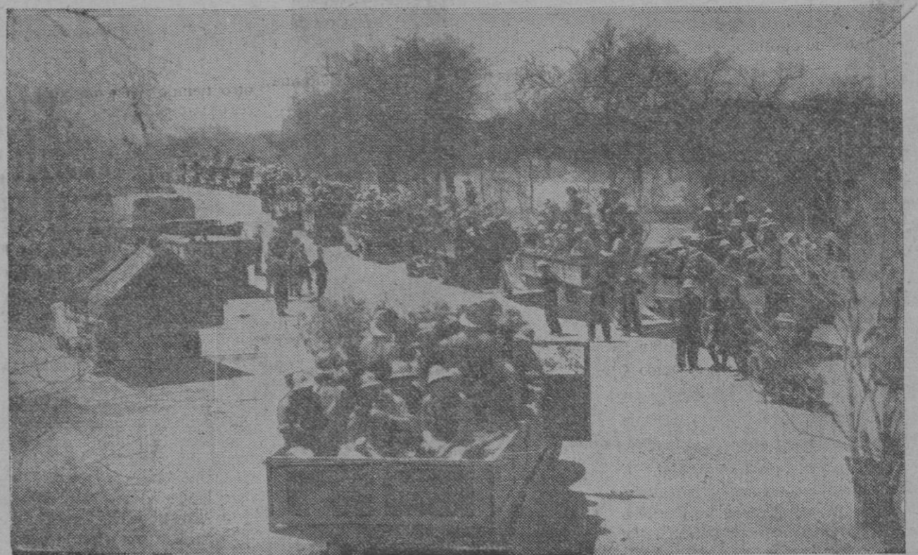
La columna italiana motorizada dispuesta para una de las marchas decisivas hacia Addis Abeba

La Legación de Francia, en la que hay dos mil refugiados, está sitiada por bandas de saqueadores