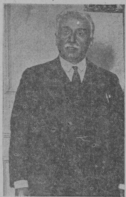
Don Niceto Alcalá Zamora, cuya destitución de la presidencia de la República fué acordada anoche por el Parlamento