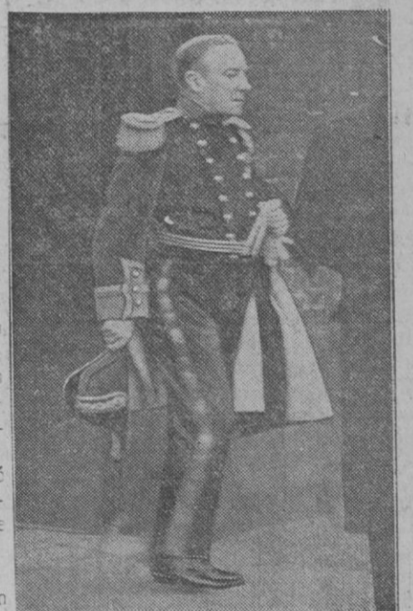
El jefe del Gobierno inglés Stanley Baldwin

Londres, 6 (2 t.).—Según comunicó el «Daily Mail», el primer ministro Stanley Baldwin, ha decidido dimitir debido a su creciente sordera. Se cree que habrá de pasar a ser lord presidente del Consejo con Nevill Chamberlain, como primer ministro, y lord Halifax o sir Robert Horne como ministro de Relaciones Exteriores. Ramsay Mc Donald permanecería en su puesto de lord del Sello privado.—United Press.