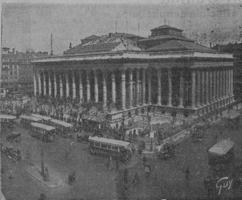
La Bolsa de Paris, con motivo de la crisis del franco

El presidente levanta la sesión a las nueve menos cuarto.