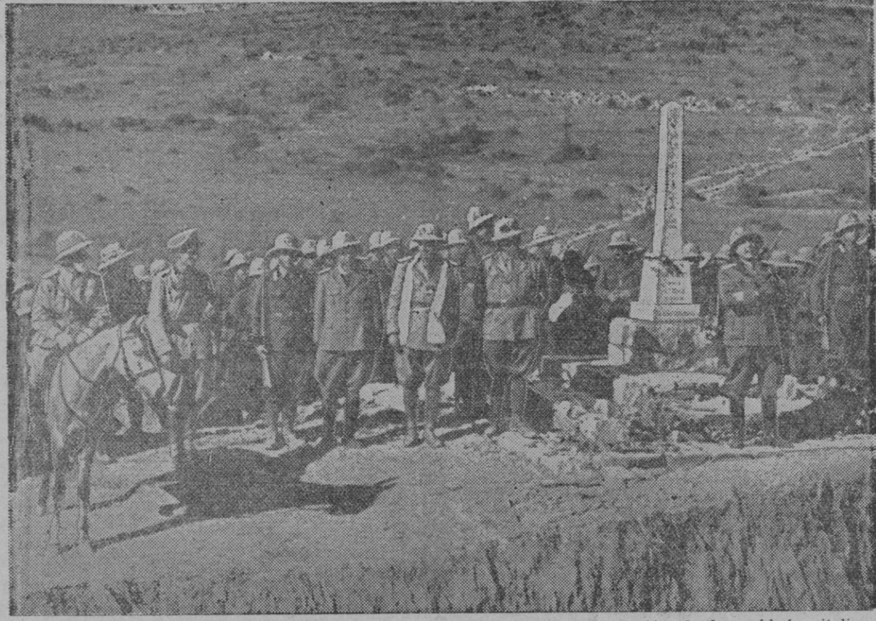
Una vista de la inauguración del monumento erigido en Adua en conmemoración de los soldados italianos muertos en la batalla de 1896. A la izquierda se halla el general Di Bono a caballo.