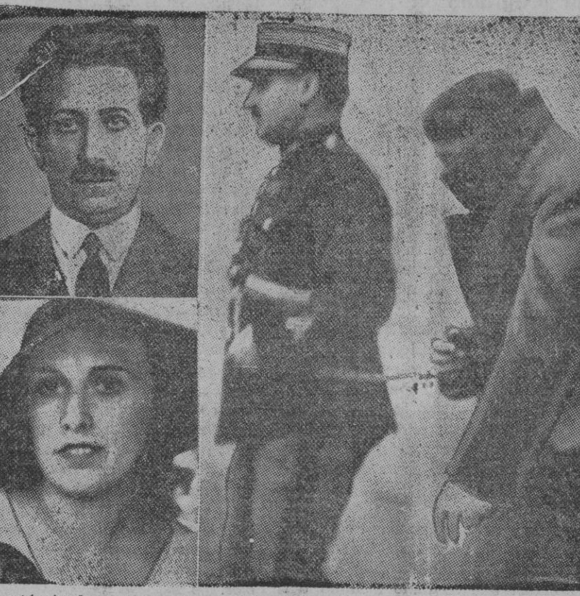
Se está viendo, actualmente, ante los Tribunales de París, el famoso proceso Stawisky, una de las más grandes y escandalosas estafas mundiales. En esta fotografía aparecen: A la izquierda, el tristemente célebre Stawisky, que, como se sabe, se suicidó, al ser descubiertos sus falsos manejos financieros, tan atentatorios para el ahorro francés, y su viuda Arlette. A la derecha, está Mr. Tinnier, director de la Agencia de empleados de Bayona, una de las más importantes figuras en el asunto que se halla en manos de la Justicia y cuyo individuo concurre a un interrogatorio judicial, en el cual ha declarado sobre las circunstancias en que se hizo la emisión de 230 millones de francos en bonos falsos. Se ha ordenado una investigación sobre este hecho y sobre las insinuaciones del tasador de joyas del Crédito Municipal de Bayona Mr. Cohen, referentes a que el señor Stawisky poseía un carnet especial que se da a los parlamentarios y a que era amigo íntimo suyo el ex ministro de Salud pública, Albert Dalimier.

Tenemos conocimiento de la actitud del Gobierno español frente a la Casa Paramount, editora de la película «Tu nombre es tentación», en la que se difama a España. El día 11 del corriente expira el plazo concedido para retirar esa cinta del mercado mundial y destruir el negativo. A las doce de la noche de ese día serán prohibidos en todo el país todos los «films» de esa firma si para entonces no se ha dado completa satisfacción a nuestro Gobierno.