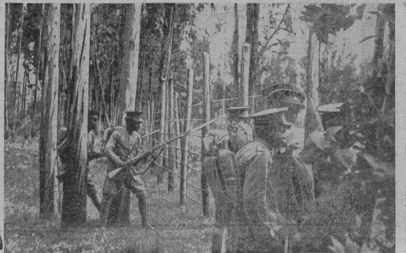
Soldados abisinios preparados para la defensa detrás de un cercado de alambre con púas