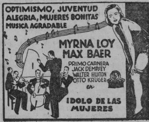
La mejor y más emocionante película del año