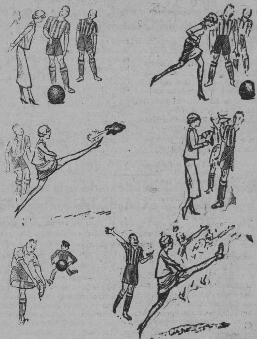
El «kicks off» de la presidenta honoraria del club.

Fué amenizado por la banda de música de la Academia de Artillería, que interpretó los bailables más en boga. Se hizo un derroche de disparo de serpentina y la fiesta transcurrió agradablemente, prolongándose has-