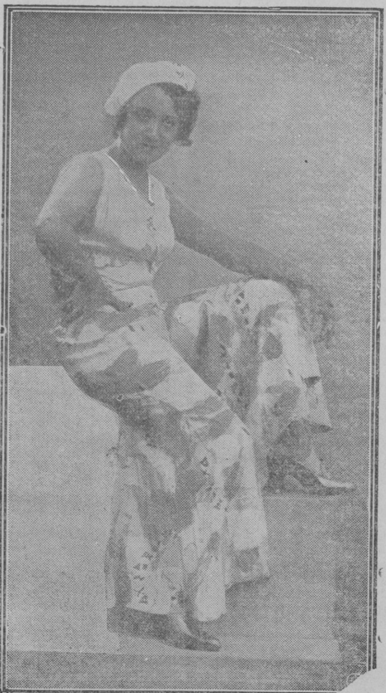
ANITA LASALLE es una de las artistas españolas de más prestigio y que cuenta, mercedamente, con mayor número de admiradores. Lo que nos extraña viendo la originalidad de sus «deshabillés» mitad náuticos y mitad pijamas como el de esta foto, en la que no sabemos qué admirar más, si a la artista, la seducción de la «posse» o el vestido.