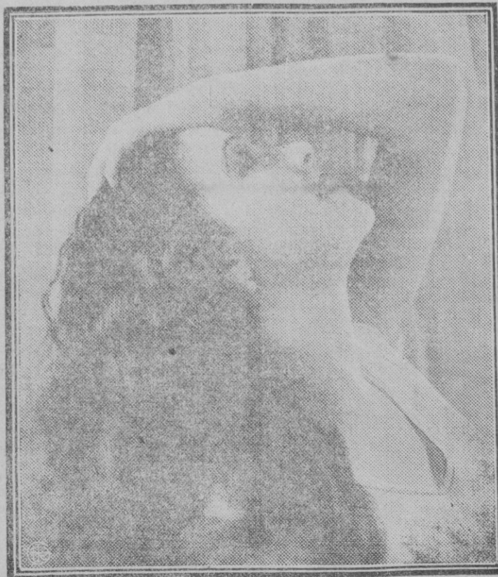
Rosita Moreno, la genial intérprete del cine parlante hispanoamericano, ofrece a la contemplación de sus innumerables admiradores esta pose, que es un fotogénico argumento para los detractores de la melena corta.