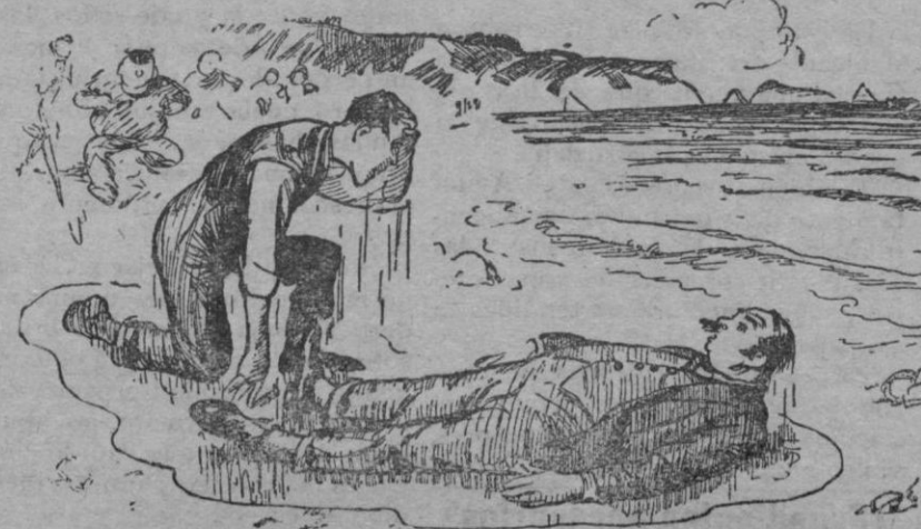
UN DRAMA EN EL MAR El héroe pobre (después de haber salvado al náufrago): —¡Dios mío! ¡Si es mi sastre!

Desde antiguo, ya en la época del transparente arroyuelo—antesapado de la luna del armarío y del espejito del bolsón—la mujer, al contemplarse coquetueta, no veía sino lo que se le antojaba. Nunca verdad tan evidente como una superficie de brillante destinada a reproducir honradamente, pasivamente cuanto se le enfrentara, pasó por el suplicio y la impostura de desfigurarse, de negarse a sí propia en la mentira más descarada y tiránica que Eva le imponía. El espejo, cuya principal y perentoria misión consistía en ser paladín de la verdad, con vano cinismo de bufón, renunciaba a sus prerrogativas y charlaba estúpidamente. Y el rostro desvalido seguía deslumbrando como opulento y la arruga era un incentivo, y el ocaño una llamarada y la claudicación una gentileza. ¡Pobre trozo de cristal, execrable más que un montón de sofocan como si aspirasen a insi-