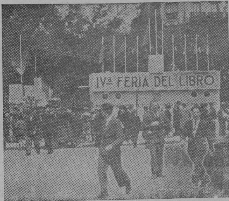
En el paseo de Recoletos de Madrid, tuvo lugar el domingo a las once de la mañana la inauguración de la IV feria del libro. El presidente de la República Sr. Azaña, visitó la feria, adquiriendo varios ejemplares.