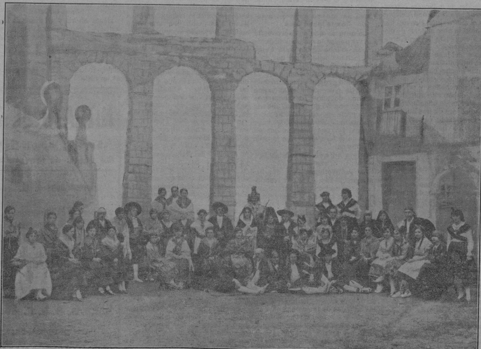
Interesante grupo de bellas señoritas y distinguidos jóvenes que en el teatro Juan Bravo tomaron parte en el cuadro «Los cantos regionales». La decoración representa la plaza del Azoguejo, donde se levanta el trozo más esbelto del famoso Acueducto romano