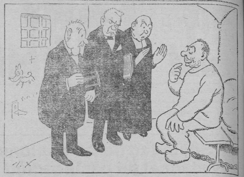
Les voy a pedir un último favor: Dejenme tomar unas tabletas de Aspirina, para que no me duela la cabeza.