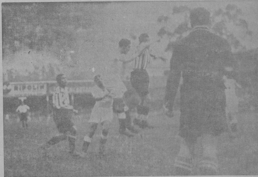
FUTBOL.—Un corner contra la meta del Valencia, en el partido celebrado con el Athletic de Bilbao, en San Mamés.