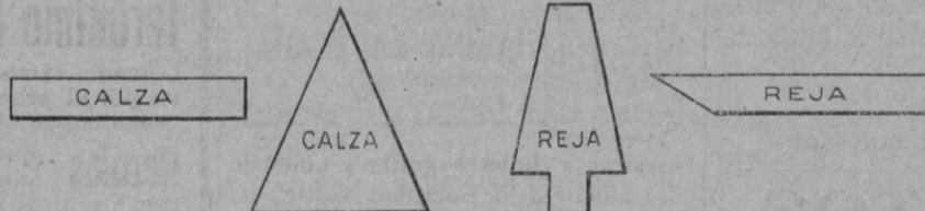
RECORTES Y PLETINAS PARA FABRICACIÓN DE HERRADURAS