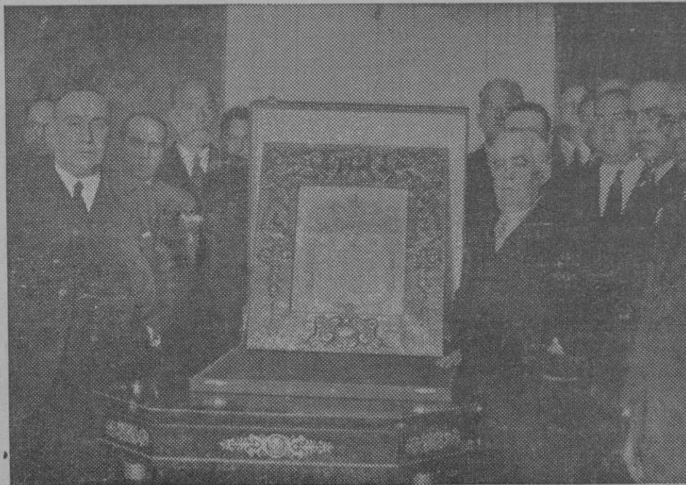
HOMENAJE AL SR. CHAPAPRIETA.—Acto de entrega, por una Comisión de diputados de Alicante, de un artístico pergamino nombrando al Sr. Chapaprieta, hijo predilecto de aquella localidad.