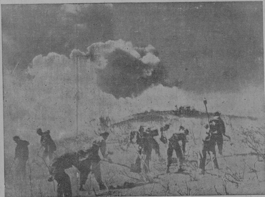
UN INCENDIO EN HOLLYWOOD.—Un violento incendio ha destruido en Hollywood varias casas pertenecientes a celebridades de la pantalla. Los soldados del ejército de los Estados Unidos trabajando en la extensión del siniestro.