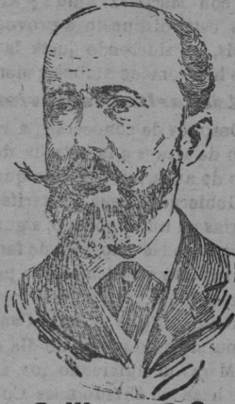
Don Guillermo G. Osma, ex ministro de Hacienda, que ha fallecido en Biarritz