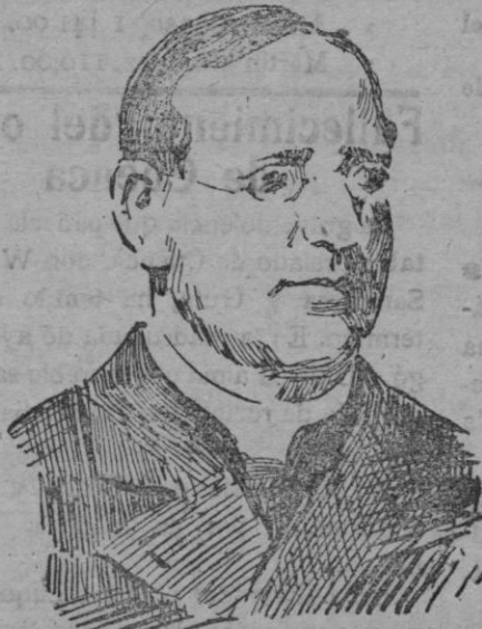
Monsiñor Aquiles Ratti, cardenal elegido Sumo Pontífice el 6 de Febrero de 1922