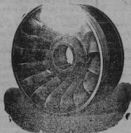
Rodetes Turbina "Francis,"

Cilindros para molinoria de fundición endurecida