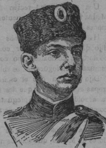
Alejandro Karageorgewloh, príncipe regente, que por fallecimiento de su padre Pedro I, ha sido proclamado rey de Serbia, encontrándose enfermo en París