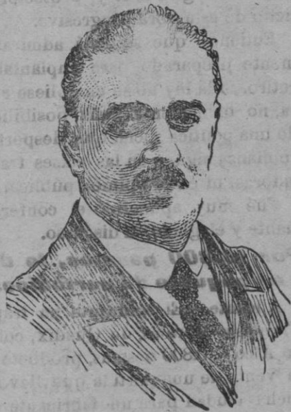
Don Julio Casares,

insigne literato, que ha ingresado en la Academia de la Lengua recientemente.