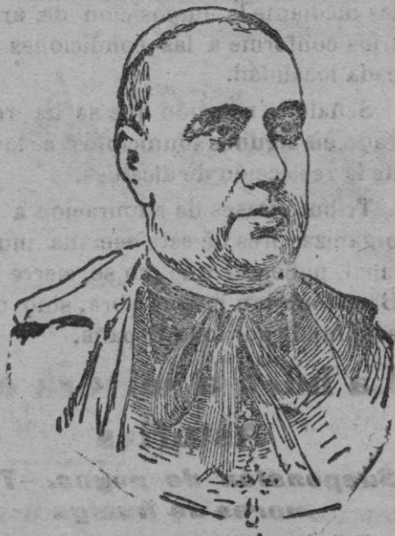
El cardenal Almaraz y Santos, primado de España, que con gran pompa ha hecho su entrada el domingo último en Toledo