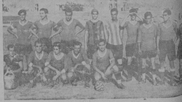
El equipo de Selección que jugó el domingo contra el Mallorca.