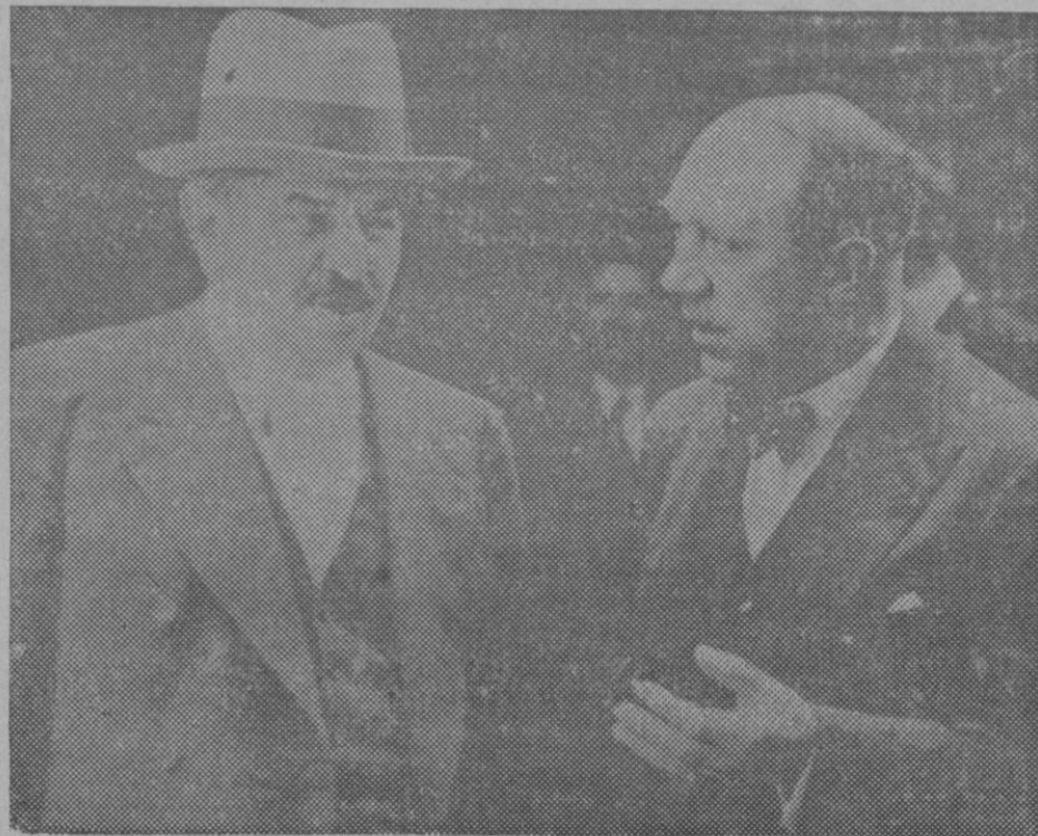
LAVAL EN GINEBRA.—Un reporter haciendo preguntas a M. Laval a su salida de la sesión del Consejo de la S. de N.

El comité de los cinco y sus expertos sigue ocupado con el estudio de la situación de Italia y Abisinia para presentar un informe al Consejo sobre alguna solución que merezca recomendarse a los interesados, con