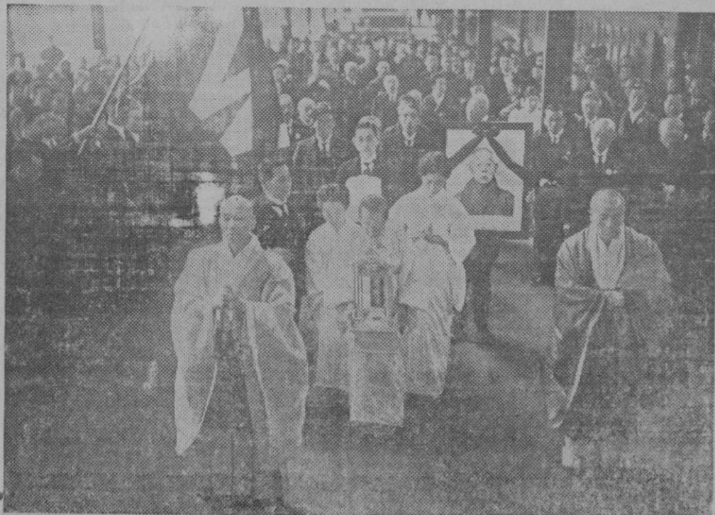
HONRAS FUNEBRES JAPONESAS.—Ceremonia del traslado del cadáver del gran sabio Teishobuchi, figurando en un cuadro el retrato del difunto.