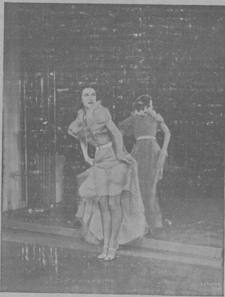
Eleanor Powell, aclamada como «la mejor zapateadora del mundo», ejecuta uno de los maravillosos bailables que se admirarán en la suntuosa película musical actualmente en producción en los estudios Metro-Goldwyn-Mayer

El caso de René Clair es típico. Tenía en su haber films como «Los dos tímidos», «El sombrero de paja de Italia» y su fantástico «Viaje imaginario» y aun había quien le negaba conocimientos cinematográficos para dirigir una película. No menos paradójicas son las críticas contra Cecil B. de Mille. Este hombre que como nuevo Mesías nació al cine en un modestísimo estable de Hollywood, cuando ni siquiera se podía soñar en la existencia de la Mecca del cine, que