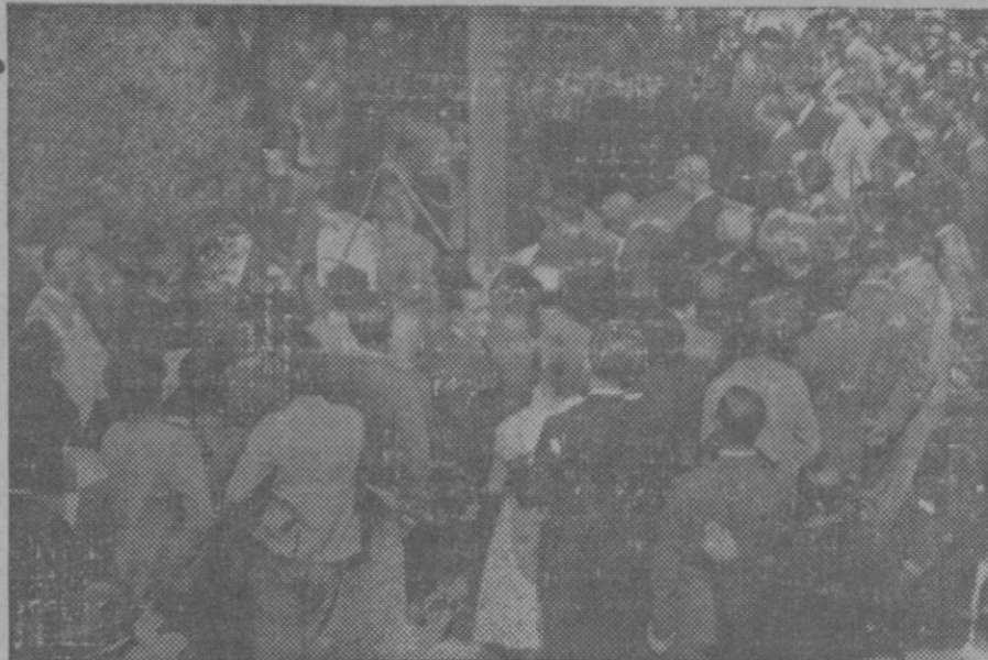
FALLECIMIENTO DE D. MANUEL B. COSSIO.—Momento de dar sepultura al cadáver de D. Manuel B. Cossio en el cementerio de Madrid, en cuyo acto asistieron varias personalidades.

Siguen en Ginebra los cabildeos para hallar una fórmula de arreglo.