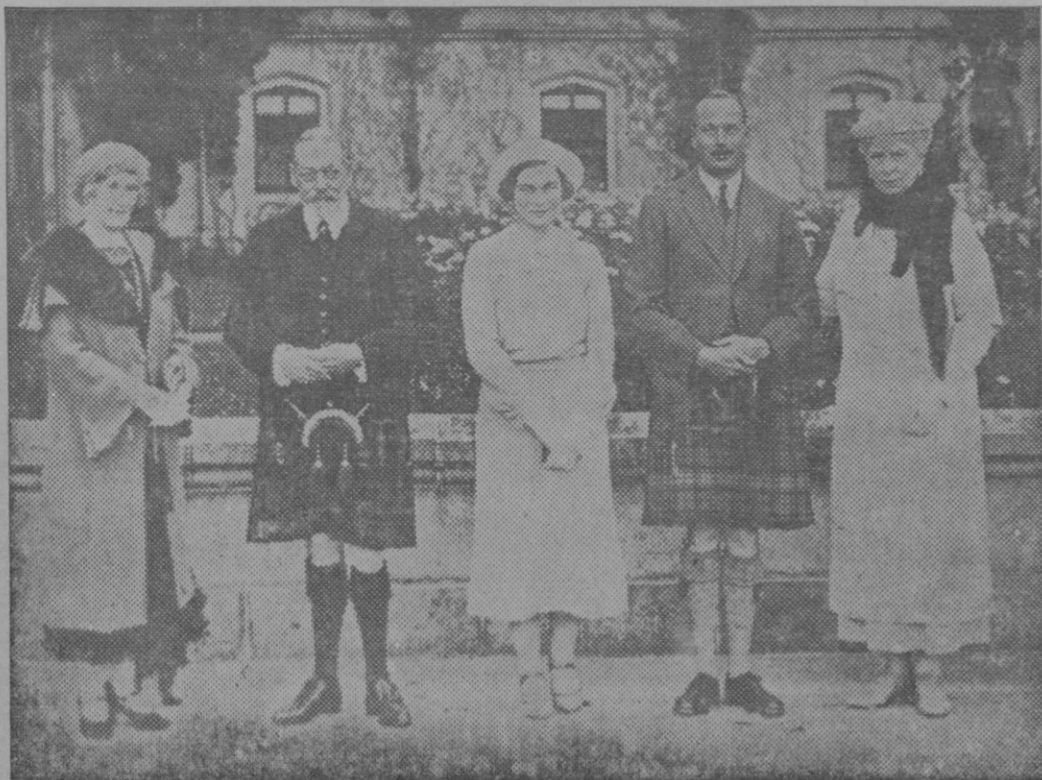
EL DUQUE DE GLOUCESTER Y SU NOVIA.—De izquierda a derecha, la duquesa Buceleuch, madre de la novia.—El Rey de Inglaterra, los novios y la Reina de Inglaterra, en el jardín del castillo de Balmoral.