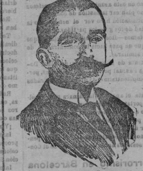
Pedro Muñoz Secs, celebrado escritor y autor del sainete «El Parque de Sevilla», que con gran éxito se ha representado en el teatro Apolo de Madrid