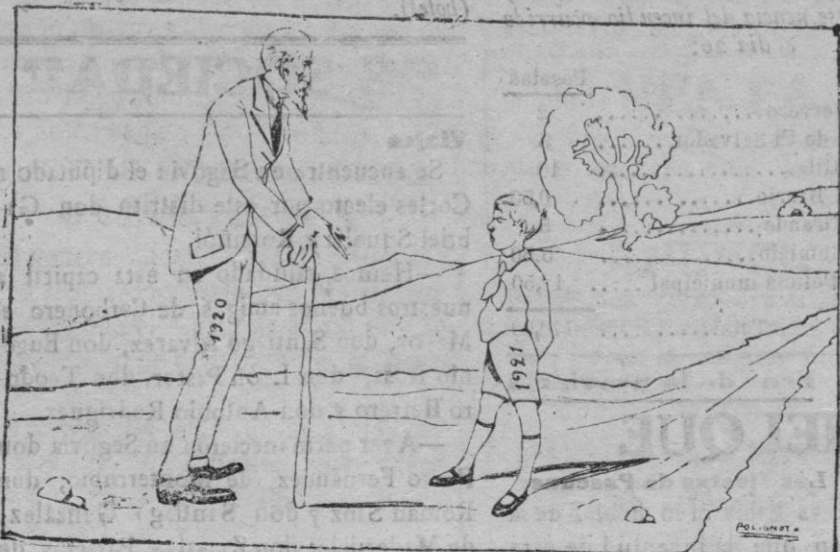
AÑO NUEVO... VIDA VIEJA

El viejo.—¿Y tú qué eres, bolchevique? El niño.—Yo, conservador de todos los viejos moldes... El viejo.—Sí, sí, como yo; ¿y hambre, no traes mucha? El niño.—Bah, en todo el camino no he probado bocado.