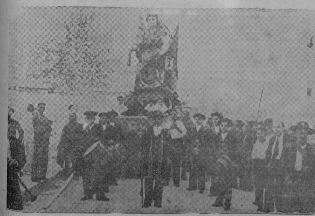
DESFILE DE CARROZAS.—La carroza de Palma.