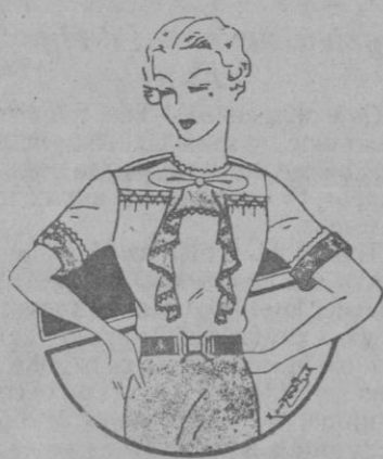
Blusa de seda blanca con aplicaciones en azul. Muy fina y susceptible de acomodarse con cualquier falda.