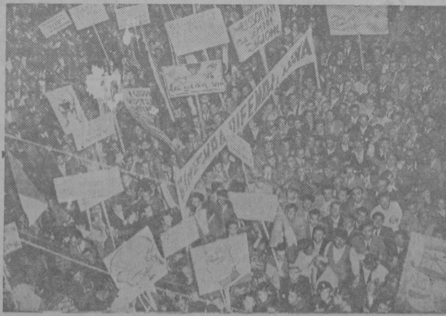
MANIFESTACION EN ROMA POR LA GUERRA CONTRA ETIOPIA.—Una vista de la muchedumbre en la «Piazza Colonna». Se ven los estandartes y las caricaturas humorísticas dedicadas a Inglaterra, Japon y a la Sociedad de Naciones.