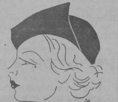
Elegante sombrero de verano en paja negra. Apunte de la moda en París.