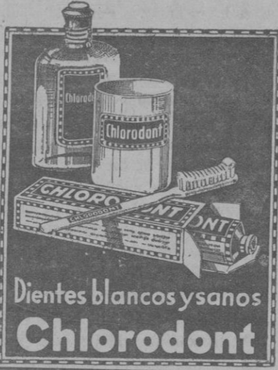
Dientes blancos y sanos Chlorodont

Para retirar la mascarilla, una vez cortadas las tiras de gasa que la sostenían, hay que empapar varias toallitas ateadas pequeñas, en agua caliente y colocarlas, cubriendo por entero la cara y el cuello. Habrá necesidad de repetir la operación varias veces hasta conseguir que la pasta se suavice y se desprenda sin necesidad de frotar la piel. Unafricción de la piel en este caso, echará por tierra todos los buenos efectos de la mascarilla. Carmencita HEAD'S