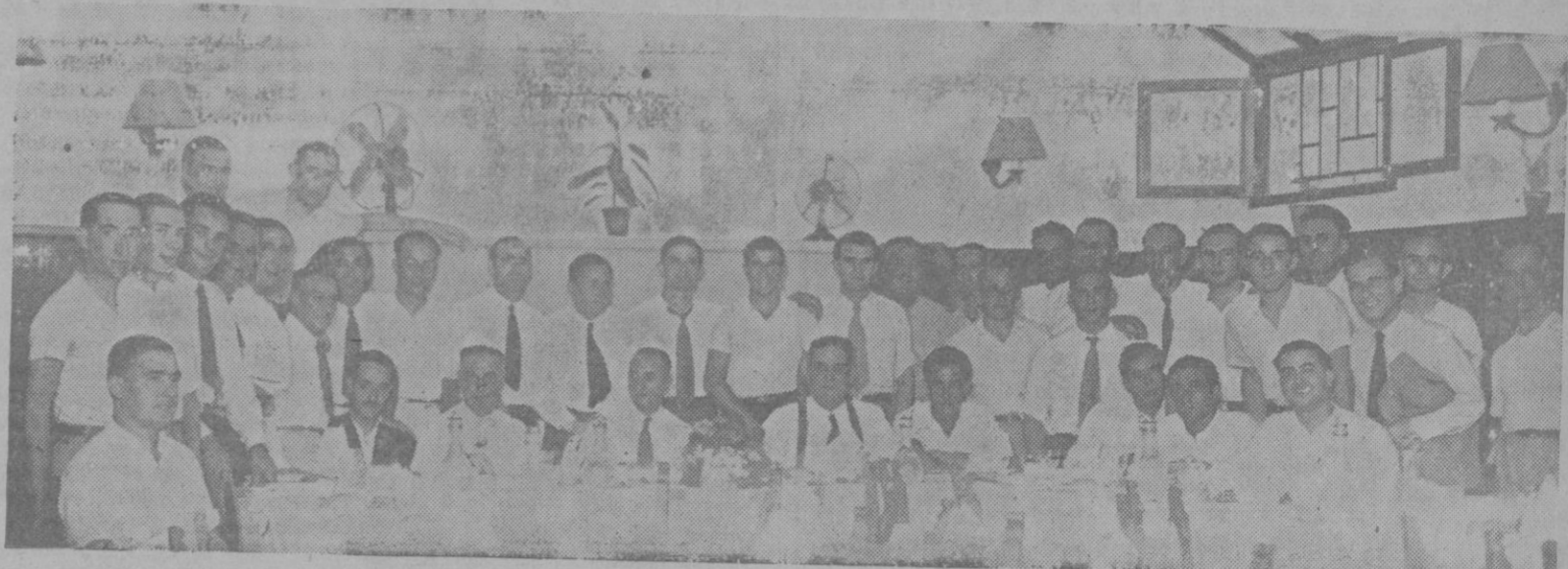
EL PATRON DE VIZCAYA.—Los elementos directivos del Fronton Balear, pelotaris y simpatizantes, en el banquete celebrado en el «Restaurante Oriente» para conmemorar la festividad de San Ignacio de Loyola.

En una de esas treguas, hace ya años, mi encuentro con Maragall. Fué en la biblioteca de mi casino provinciano, abiertas a la luz suave