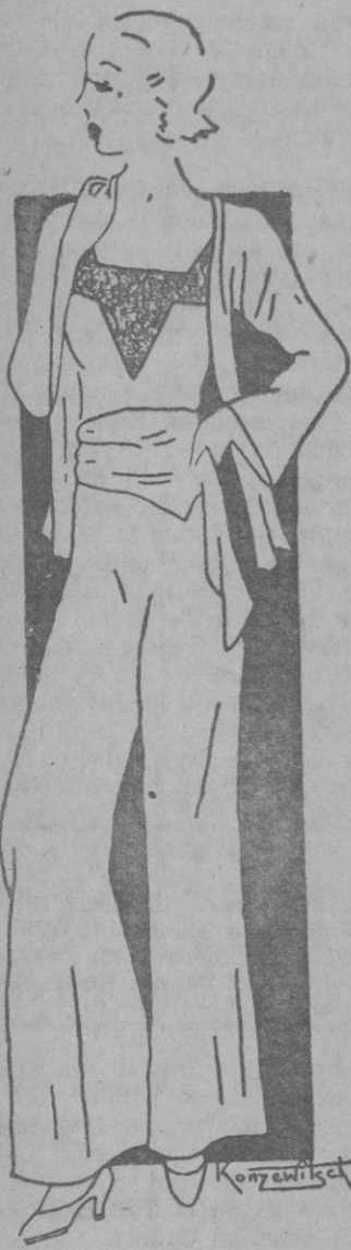
Piñama en blanco con fina chaquetilla, muy a propósito para la playa.