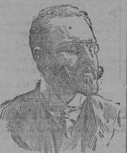
Don Emilio Ortuño, ex director general de Correos, actualmente ministro de Fomento

caen sobre especies que ya sufren gravamen.