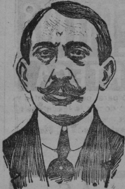
El doctor Sergio Voronoff, descubridor del injerto de las glándulas intersticiales para la curación de la vejez.