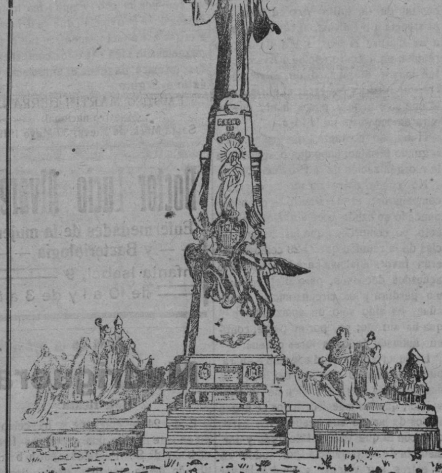
Monumento dedicado al Sagrado Corazón de Jesús levantado por suscripción nacional en el centro de España (Cerro de los Angeles, Madrid). (Obra del laureado escultor don Aniceto Marinas)