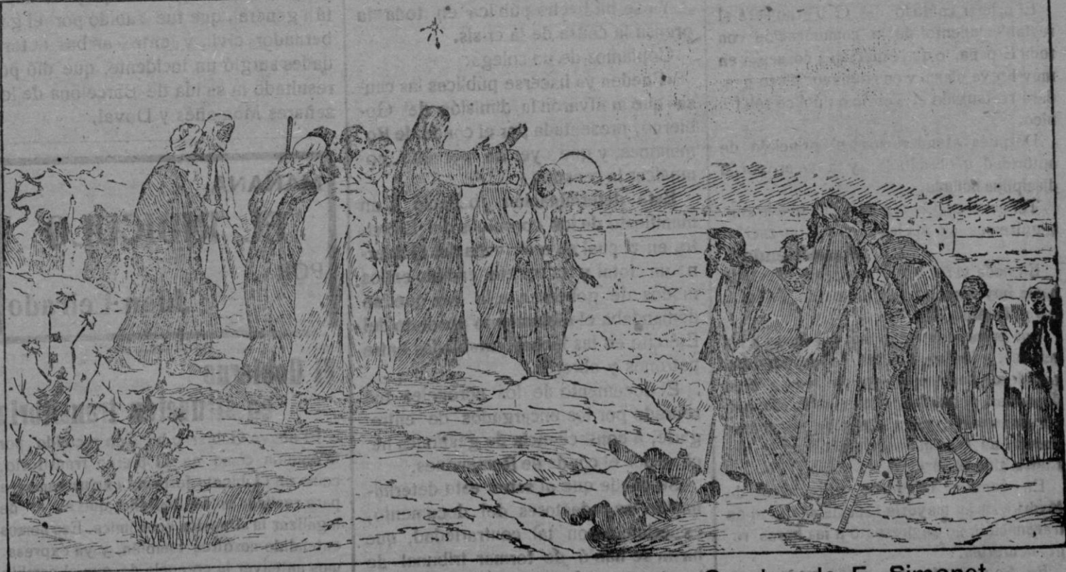
FLEVIT-SUPER-ILLAN (Sermón de la Montaña).—Cuadro de E. Simonet Existente en el Museo de Arte Moderno (Madrid)

—Y aquella visión que llenaba su alma de mortal angustia y su carne de supremos espasmos de congoja y agonía y mostrábase