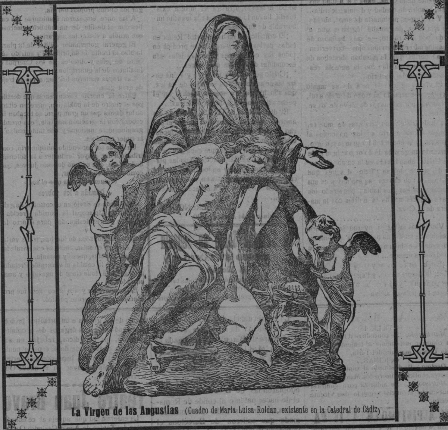
La Virgen de las Angustias (Cuadro de María Luisa Roldan, existente en la Catedral de Cádiz)