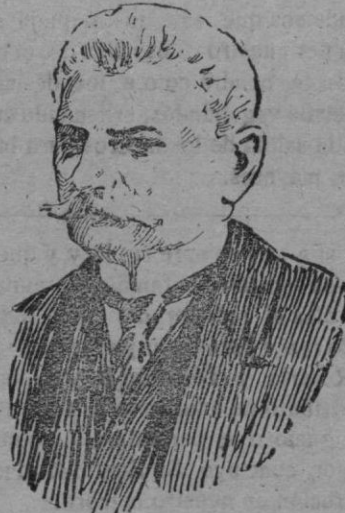
El señor Sonnino

ex presidente del Consejo italiano y sagaz diplomático que representa a Italia en las Conferencias de la paz.