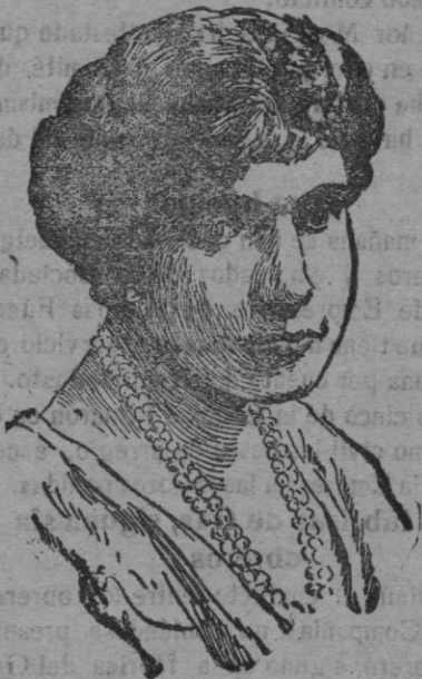
La Reina María de Rumania, que se halla en Londres, siendo muy aclamada por todos